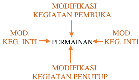
Gambar 2. Modifikasi Kegiatan Inti