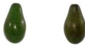
Gambar 2. Alpukat Mentah dan Matang

Pengujian sistem klasifikasi Naive Bayes ini bertujuan untuk mengetahui keakuratan sistem dalam mengklasifikasi tingkat kematangan buah alpukat, apakah termasuk matang atau mentah. Uji coba dilakukan dengan menggunakan 30 gambar buah alpukat matang dan 30 buah alpukat mentah dipaparkan dalam Gambar 2 . Alpukat Mentah dan Matang.