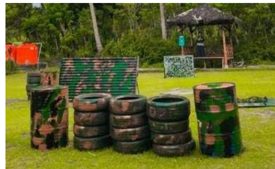
Gambar 7. Pendampingan Branding dan Pembuatan Arena Paintball

Pendampingan selanjutnya adalah pendampingan pemasaran digital. Kegiatan ini dilaksanakan pada 16 September 2022. Pada kegiatan ini juga dilakukan pendampingan dalam pembuatan dan pengelolaan website balkondes dan paintball yang juga menjadi luaran dari kegiatan PKM ini. Gambar 8 merupakan kegiatan pendampingan dan website balkondes wringinputih .