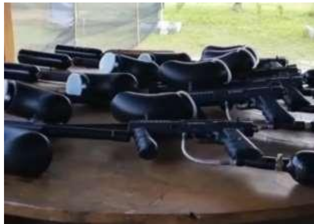
Gambar 13. Pembelian Peralatan Paintball .

Setelah kegiatan pelatihan dan pendampingan penguatan SDM, kegiatan berikutnya adalah pembelian peralatan paintball . Kegiatan ini kami lakukan sebagai bentuk persiapan pemasaran yang akan dilakukan. Pembelian peralatan paintball ini meliputi pembelian amunisi, tabung gas, seragam paintball , dan peralatan lain yang mendukung kegiatan paintball . Kegiatan ini kami lakukan pada tanggal 12 Oktober 2022. Dokumentasi kegiatan ini tersaji pada gambar 13.