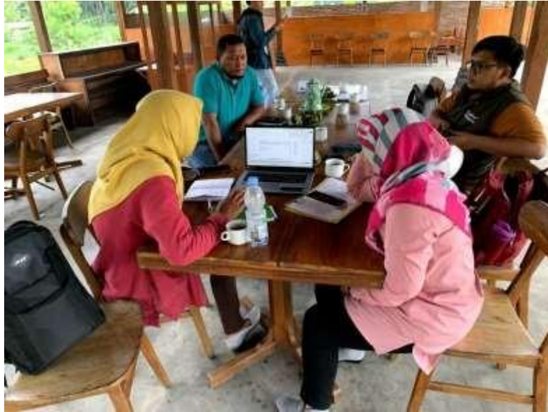
Gambar 5. Pelatihan Pengelolaan Keuangan dan Akuntansi BUMDes

Rangkaian kegiatan yang kedua adalah terkait dengan pendampingan. Pendampingan pertama adalah branding paintball . Kegiatan ini dilaksanakan pada 14 September 2022 di Pendopo Rest Area Desa Wringinputih. Hasil dari kegiatan ini adalah adanya brand untuk paintball , yaitu "Wringinputih Paintball". Dokumentasi kegiatan ini tersaji pada Gambar 6.