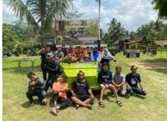
Gambar 14. Pembuatan Dokumen Video

Setelah semua kegiatan dilakukan, tim PKM melakukan koordinasi terakhir dengan seluruh anggota BUMDes Wringinputih. Koordinasi ini bertujuan untuk mengevaluasi kegiatan yang sudah dilakukan tim PKM serta keberlanjutan dari kegiatan yang sudah dilakukan. Kegiatan ini dilakukan pada 26 Oktober 2022. Dokumentasi kegiatan ini tersaji pada gambar 16.