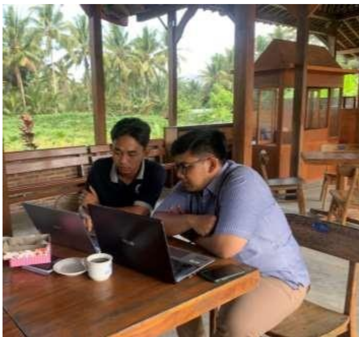
Gambar 8. Pendampingan pembuatan dan pengelolaan website