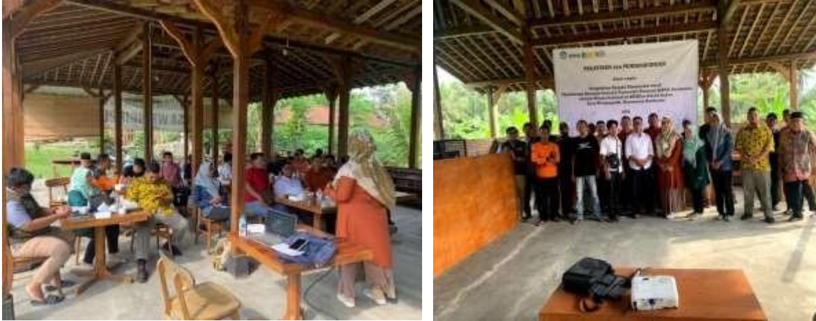
Gambar 12. Pelatihan dan Pendampingan Penguatan SDM

Setelah kegiatan pelatihan dan pendampingan penguatan SDM, kegiatan berikutnya adalah pembelian peralatan paintball . Kegiatan ini kami lakukan sebagai bentuk persiapan pemasaran yang akan dilakukan. Pembelian peralatan paintball ini meliputi pembelian amunisi, tabung gas, seragam paintball , dan peralatan lain yang mendukung kegiatan paintball . Kegiatan ini kami lakukan pada tanggal 12 Oktober 2022. Dokumentasi kegiatan ini tersaji pada gambar 13.