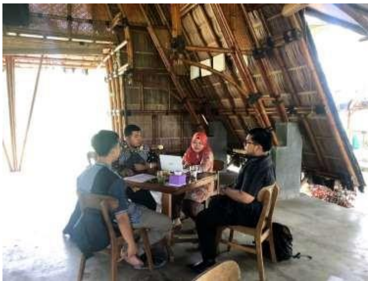
Gambar 1. FGD Tim PKM dengan Mitra

Merujuk pada tahapan pelaksanaan PKM yang terdiri dari empat tahap yaitu sosialisasi, pelatihan, pendampingan, dan implementasi teknologi, dan tim pengabdian telah melaksanakan sebagian besar kegiatan tersebut. Namun, sebelum melakukan empat kegiatan tersebut, pada tanggal 21 Juli 2022 tim pelaksana PKM melakukan forum group discussion (FGD) terlebih dahulu untuk memperoleh permasalahan yang ada di BUMDes Guyub Rukun. Gambar 1 merupakan dokumentasi dari FGD tim PKM dengan mitra.