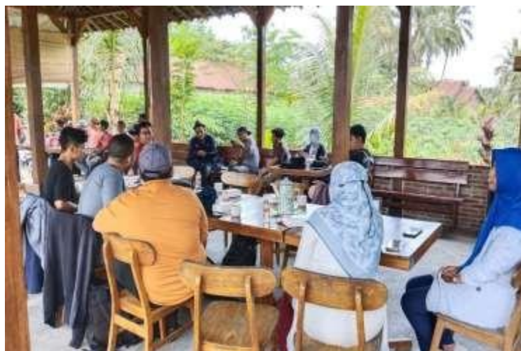
Gambar 2. Sosialisasi Kegiatan PKM

Kegiatan yang pertama dilakukan adalah sosialisasi dengan memberikan informasi kegiatan kepada mitra tentang kegiatan PKM yang akan dilakukan. Kegiatan ini dilaksanakan di Balkondes Wringinputih pada 28 Juli 2022. Sosialisasi ini dihadiri oleh Direktur Bumdes dan Bendahara, dosen, dan mahasiswa. Gambar 2 merupakan dokumentasi hasil kegiatan ini.