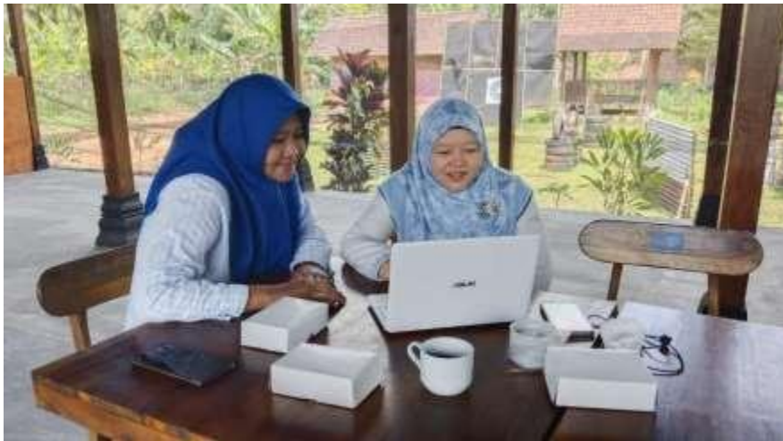
Gambar 10. Pendampingan Keuangan (Akuntansi)

Pendampingan selanjutnya yang telah dilaksanakan adalah pengelolaan keuangan. Pada pendampingan ini, kegiatan di khususkan dengan direktur BUMDes, manajer balkondes wringinputih, dan bendahara BUMDes. Kegiatan ini dilaksanakan pada 21 september 2022. Fokus pada kegiatan ini adalah untuk memberikan pendampingan dari permasalahan-permasalahan akuntansi yang dialami oleh pihak BUMDes. Dokumentasi kegiatan ini tersaji pada Gambar 10.