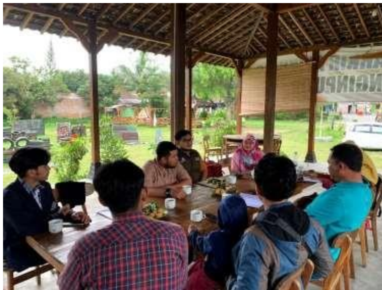
Gambar 6. Pendampingan Branding

Rangkaian kegiatan yang kedua adalah terkait dengan pendampingan. Pendampingan pertama adalah branding paintball . Kegiatan ini dilaksanakan pada 14 September 2022 di Pendopo Rest Area Desa Wringinputih. Hasil dari kegiatan ini adalah adanya brand untuk paintball , yaitu "Wringinputih Paintball". Dokumentasi kegiatan ini tersaji pada Gambar 6.