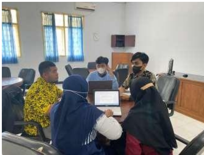
Gambar 11. Rapat Koordinasi Pelaksanaan Kegiatan Pelatihan dan Pendampingan Serta Pemasaran Paintball

Kegiatan berikutnya adalah rapat koordinasi pelaksanaan kegiatan pelatihan dan pendampingan serta pemasaran paintball . Rapat koordinasi ini kami lakukan untuk menentukan tindaklanjut mengenai bagaimana pelatihan dan pendampingan untuk pemasaran Wringinputih Paintball akan dilakukan. Kegiatan ini dilaksanakan pada 3 Oktober 2022 dan sebelumnya pada tanggal 1 Oktober 2022 kami melaksanakan pembuatan dokumen video sebagai persiapan untuk melakukan pemasaran digital. Dokumentasi kegiatan ini tersaji pada gambar 11.