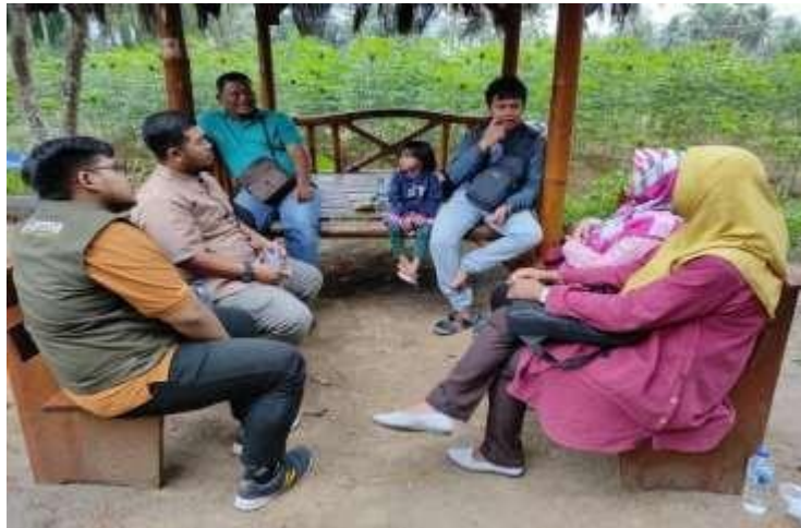
Gambar 15. Koordinasi dengan BUMDes

Setelah semua kegiatan dilakukan, tim PKM melakukan koordinasi terakhir dengan seluruh anggota BUMDes Wringinputih. Koordinasi ini bertujuan untuk mengevaluasi kegiatan yang sudah dilakukan tim PKM serta keberlanjutan dari kegiatan yang sudah dilakukan. Kegiatan ini dilakukan pada 26 Oktober 2022. Dokumentasi kegiatan ini tersaji pada gambar 16.