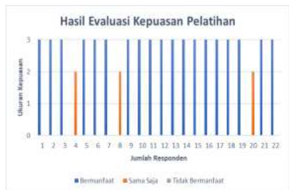
Grafik 1 Evaluasi Kepuasan Pelatihan

Akhir dari kegiatan PKU ini adalah evaluasi kegiatan dengan metode survei menggunakan kuesioner yang dibagikan kepada peserta kegiatan.