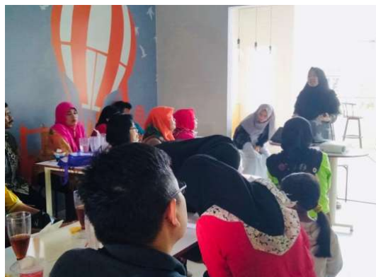
Gambar 2 Pelatihan Strategi Pemasaran

Kegiatan pendampingan terkait pelaporan keuangan sederhana dan strategi pemasaran dilakukan pada 27 September 2019 bertepatan dengan hari jadi KUB Prisma Jaya Sejahtera. Antusiasme anggota kelompok terkait materi pelatihan yang disampaikan sangat besar. Hal tersebut dapat dilihat pada gambar berikut :