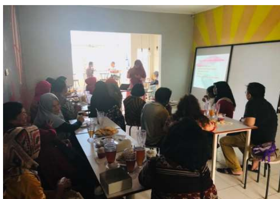
Gambar 1 Pelatihan Laporan Keuangan

pengurusan perijinan, wawancara dengan mitra, menyiapkan materi pelatihan dan juga persiapan terkait alat dan bahan yang dibutuhkan. Selanjutnya, Sosialisasi . Sebelum dilakukannya tahap pelatihan, terlebih dahulu melakukan sosialisasi kepada mitra agar seluruh anggota mitra memahami maksud dan tujuan diadakannya kegiatan ini sehingga tidak ada kesalahpahaman antara tim pengabdian dengan mitra dan agar kegiatan ini bisa berjalan lancar sesuai dengan tujuan yang diharapkan. Dilanjutkan dengan Pelaksanaan Pelatihan . Mitra diberi materi-materi yang akan disampaikan oleh tim pengabdian seperti : (1) pelatihan pengelolaan keuangan sederhana (penyusunan laporan laba rugi, menghitung dan menentukan harga jual produk), (2) Sosialisasi pemilihan kemasan produk yang aman, ekonomis dan sesuai dengan produk yang dihasilkan masing-masing mitra, dan (3) Pendampingan strategi pemasaran yang dapat mendukung usaha dari mitra. Kemudian Tahap Pendampingan . Kegiatan ini dilakukan untuk mengetahui seberapa jauh mitra memahami dan mampu mengaplikasikan pelatihan yang telah didapatkan sebelumnya yang kaitannya dengan permasalahan yang dihadapi oleh mitra sehingga permasalahan tersebut bisa diselesaikan. Terakhir melakukan Evaluasi dan Pelaporan dengan mendiskusikan kembali kegiatan yang sudah dilakukan, kemudian mensurvei kepuasan mitra terhadap kegiatan pengabdian ini, serta menyelesaikan laporan akhir kegiatan dengan tim pelaksana.