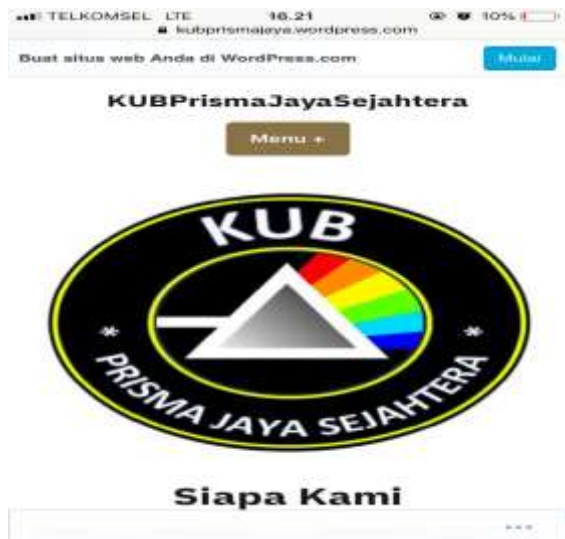
Gambar 3 Desain Website

Pendampingan selanjutnya terkait penggunaan website sebagai media pendukung kegiatan promosi mitra dilaksanakan pada tanggal 12 Oktober 2019, yang hanya diikuti oleh ketua kelompok sebagai pemegang kendali atas website yang nanti akan digunakan, berikut layout desain website sederhana yang sudah dihasilkan: