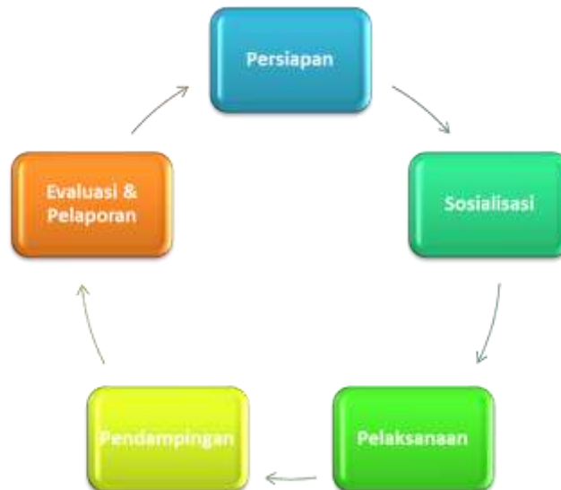
Gambar 1. Skema Metode Pelaksanaan

Ketua tim akan menentukan standar pelaksanaan kerja, mengkoordinasi dan mengarahkan kepada anggotanya dalam setiap kegiatan. Sedangkan anggota tim akan melaksanakan tugas-tugas yang telah ditentukan. Dimana antara ketua dan anggota mempunyai tugas masing-masing dan saling terintegrasi.