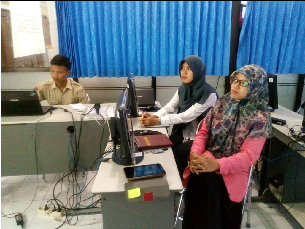
Gambar3. Pendampingan dan evaluasi materi presentasi Bahasa Inggris