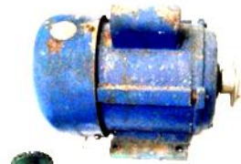
Gambar 3. Motor penggerak.

Modern sebagai tenaga penggerak. Motor memiliki daya sebesar 0,5 Hp dengan putaran motor 1400 rpm dan terdapat reduksi kecepatan. Dalam uji coba, motor penggerak mampu berfungsi dengan baik dan tidak ada kendala fungsional. Motor yang diaplikasikan pada mesin yang dirancang menggunakan motor tipe Alternating Current – AC dengan tegangan operasi 220 volt terlihat dalam gambar 3.