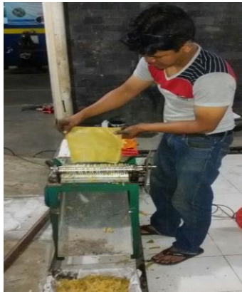
Gambar 6. Ujicoba mesin perajang.