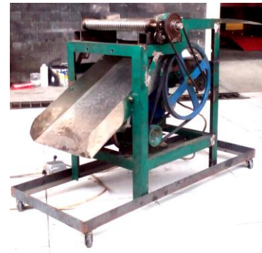
Gambar 5. Prototipe mesin perajang.

Pada tabel 1 ditampilkan hasil dari perajangan kerupuk ikan. Produk ini dibagi menjadi beberapa 3 (tiga) ukuran produk yaitu A untuk ukuran besar, B ukuran sedang dan C untuk ukuran kecil. Pada pengujian ini mesin menggunakan kecepatan satu speed. Pisau pemotong dapat berfungsi dengan baik dalam memotong bahan mentah kerupuk ikan menjadi persegi atau segi empat. Hasil rancangan mesin cukup nyaman dan aman dioperasikan, bahkan oleh operator perempuan. Pada waktu mesin dioperasikan guncangan yang dihasilkan tidak terlalu besar walaupun motor listrik berputar pada 1400 rpm. Guncangan yang terjadi tidak mempengaruhi dimensi atau posisi mesin beroperasi. Selain guncangan yang timbul, gesekan pada rel pisau pemotong juga menimbulkan panas. Panas diakibatkan oleh terjadinya gesekan antara pelat penahan pisau pemotong dan rel atau lintasan. Dengan standart bahan yang dipakai lebih dari 1 kilogram, parameter yang diamati adalah lamanya waktu selama proses perajangan, karena daya pada motor sudah diketahui dari spesifikasi motor listrik (0,5 Hp). Kebutuhan energi berbanding lurus dengan lamanya waktu perajangan. Prototipe mesin perajang kerupuk ikan terlihat dalam gambar 5.