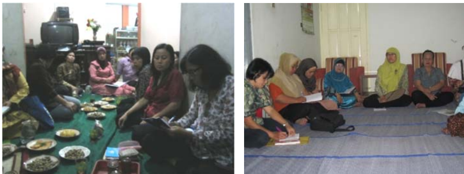
Gambar 1. Sosialisasi Kampung Organik di Tidar Campur dan Sampang

Mereka tampak antusias dengan program ini karena program tersebut juga merupakan program unggulan Kota Magelang melalui Pembentukan Kampung Organik di setiap RW, dan bagi RW yang menyelenggarakan program ini akan diberi bantuan dari Pemerintah Kota Magelang sebesar 47 juta rupiah.