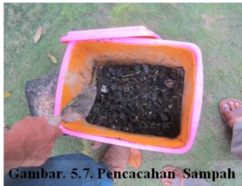
Gambar. 5.7. Pencacahan Sampah