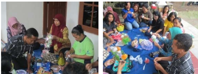
Gambar 7. Pelatihan Pengolahan Sampah Anorganik Menjadi Aneka Souvenir

Pelatihan dilaksanakan pada tanggal 5 dan 11 Juni di Tidar Campur dan tanggal 6 dan 13 Juli 2014 di Sampangan. Hasil pelatihan diharapkan dapat menghasilkan produk-produk yang dapat dimanfaatkan untuk keperluan sehari-hari seperti taplak dan tudung saji serta dapat dijual sebagai souvenir.