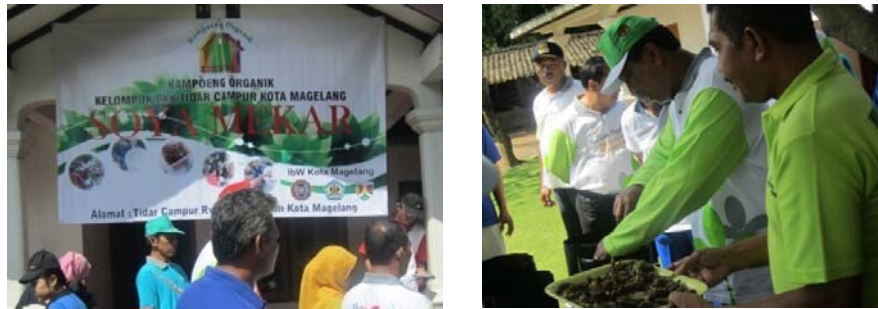
Gambar 6. Peresmian Kampung Organik Soya Mekar oleh Walikota Magelang

Kampung organik Soya Mekar di Tidar Campur pada tanggal 1 Juni 2014 diresmikan oleh Walikota Magelang sebagai kampung organik ketujuh yang telah dibentuk di Kota Magelang. Peresmian dilaksanakan pada saat Walikota Magelang melaksanakan kegiatan blusukan dari kampung ke kampung , dan ditandai dengan penanaman bibit bunga sedap malam oleh Walikota dan istri serta wakil walikota.