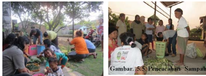
Gambar. 5.5. Pencacahan Sampah

Di kelompok kampung organik Soya Mekar, dalam pembuatan kompos juga ditambahkan kotoran ternak (sapi, ada warga yang memelihara) dan ampas tahu. Ternyata dengan menggunakan ampas tahu, proses pengomposannya menjadi lebih cepat (kurang lebih 1 minggu) dan hasilnya lebih halus, siap digunakan tanpa harus dilakukan pengayakan. Kegiatan pelatihan tersebut selanjutnya diinformasikan ke setiap RT, dan diharapkan masing-masing RT juga melakukan aktivitas pengolahan sampah organik dengan menggunakan keranjang takakura. Dengan demikian Kampung Organik di kedua tempat tersebut akan segera terealisasi.