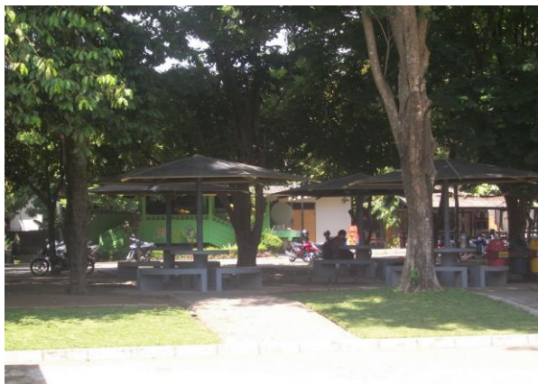
Gambar 3. Ruang terbuka di sekitar area parkir