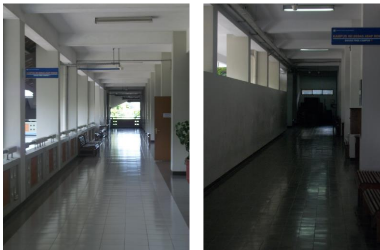
Gambar 2. Ruang terbuka di selasar kelas dan laboratorium