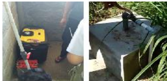
Gambar 4. Aplikasi pemasangan engine pada intalasi biogas (kiri) dan saluran biogas yang berasal dari digester (kanan).

akan hidup namun kurang stabil. Hasil aplikasi pemasangan engine pada intalasi biogas yang diatur aliran gasnya menggunakan kran/katub gas adjustable (merah) terlihat dalam gambar 4.