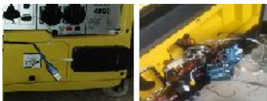
Gambar 3. Autostart control system yang diaplikasikan dalam engine .

Autostart control system bekerja berdasarkan prinsip kenaikan suhu yang ada di dalam alat penyimpanan dan pendingin susu. Saat suhu pada alat penyimpanan dan pendingin susu pada kondisi mulai tinggi (hangat) akan dibaca oleh temperature sensor . Sensor ini akan memberikan trigger ke terminal A0 pada microcontroller . Dengan triger yang diberikan oleh temperature sensor , microcontroller mengolah data dan memberikan decision untuk menghidupkan relay 01 dan relay 02. Kedua relay yang telah aktif mengalirkan arus electric dari bateray ke ignition system dan motor stater pada engine , sehingga controller akan menghidupkan engine . Engine selanjutnya menggerakkan generator untuk menghasilkan electric . Setelah suhu pada alat penyimpanan dan pendingin susu mencapai suhu kerja, engine akan beroperasi pada kondisi ECO sehingga konsumsi bahan bakar mencapai efisiensi paling tinggi. Ketika suhu terus mengalami penurunan (semakin dingin) melebihi set point , engine akan dimatikan oleh automatic control system , sehingga alat penyimpanan dan pendingin susu tidak membutuhkan asupan electric . Agar frekuensi start-stop tidak tinggi maka range set point controller di setting sedemikian rupa agar kerja engine menjadi optimal. Adapun autostart control system yang diaplikasikan dalam engine terlihat dalam gambar 3.