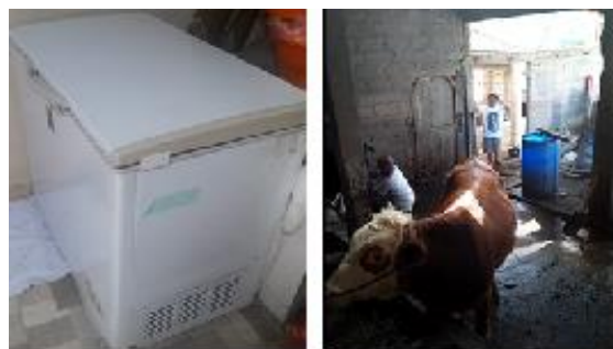
Gambar 5. Alat penyimpanan dan pendingin susu (kiri) dan kandang penghasil kotoran untuk membangkitkan biogas (kanan).

Engine yang berhasil diaplikasikan dengan energi biogas mampu menghasilkan daya electric lebih dari 3000 watt dan mampu menghidupkan alat penyimpanan dan pendingin susu dengan kapasitas 200 liter. Dengan aplikasi ini dapat menurunkan susu yang terbuang ke lingkungan, karena susu hasil perahan dapat diawetkan di alat penyimpanan dan pendingin susu. Susu yang telah diawetkan dapat dijual setelah ada permintaan dari industri pengolah susu atau dapat digunakan untuk sebagai olahan susu bentuk lain ( diversifikasi produk ). Energi yang digunakan untuk menghidupkan pendingin susu sudah tidak perlu dikeluarkan lagi, sebab energi sudah tersedia yang berasal dari biogas . Dengan demikian biaya produksi susu dapat diturunkan. Alat penyimpanan dan pendingin susu yang digunakan dalam kegiatan ini terlihat dalam gambar 5.