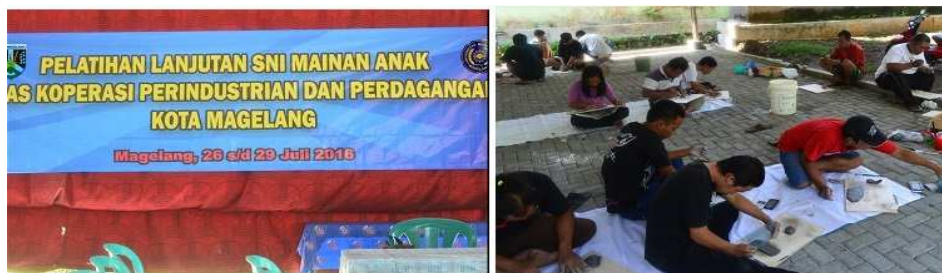
Gambar 5. Suasana Pelatihan Pengembangan Desain Produk Mainan Anak

Hasil kegiatan tersebut berupa varian produk baru yang dapat diproduksi massal dengan cepat, mudah, dan murah, serta memberikan tampilan yang lebih detail. Berikut ditunjukkan pelaksanaan dan beberapa hasil pengembangan produk dengan konsep efisiensi sumber daya.