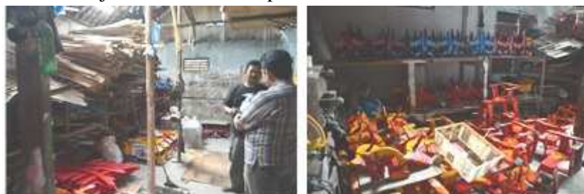
Gambar 3. Penyuluhan penataan layout lantai produksi

Pendidikan dan penyuluhan tidak diberikan secara klasikal model kelas, tetapi dilakukan dengan cara advokasi dan pendampingan karena Mitra Program jumlahnya tidak banyak. Kegiatan ini difokuskan pada penataan layout lantai produksi dan fasilitasnya, meliputi; penataan bahan baku, produk setengah jadi, produk jadi dan lay out sarana produksi, mesin dan bahan pembantu. Berikut ditunjukkan suana lantai produksi