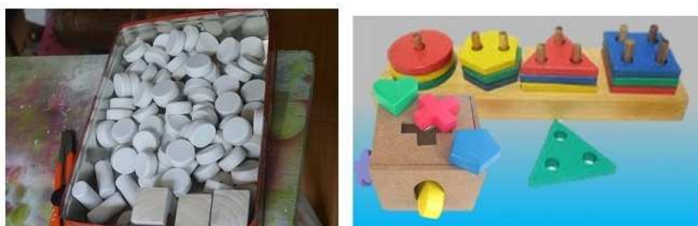
Gambar 4. Peningkatan Kualitas Produk (Aman dan Non toksin)

Selain penataan pada lantai produksi, kegiatan penyuluhan dilakukan untuk kualitas dan keamanan produk terutama produk-produk Alat Permainan Edukatif (APE). APE adalah alat permainan untuk anak usia dini yang dapat mengoptimalkan perkembangan anak, yang dapat disesuaikan penggunaannya menurut usianya dan tingkat perkembangan anak yang bersangkutan. Sehingga diupayakan yang dapat bertahan lama atau awet, mudah dibuat, bahannya mudah diperoleh dan mudah digunakan anak, tetapi aman dan tidak beracun. Berikut hasil peningkatan kualitas produk: