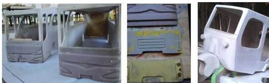
Gambar 6. Salah Satu Contoh Desain Produk yang dikembangkan (Nampak lebih detail)