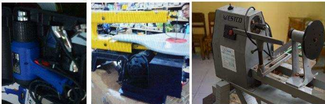
Gambar 2. Mesin yang diintroduksikan kepada Mitra

Untuk mendukung kelancaran proses produksi, Mitra Program IbM difasilitasi teknologi yang berupa antara lain, mesin pengepakan, mesin gergaji Scroll Saw, mesin bubut kayu, Brosur/logbook produk Mitra, serta cat non toxin