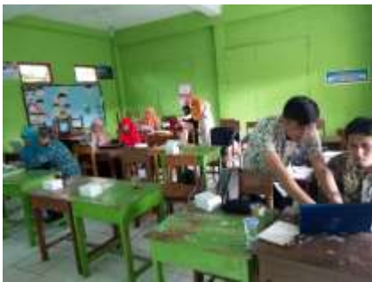
Pendampingan oleh mahasiswa