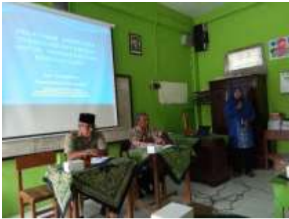
Pembukaan oleh perwakilan PRM Mungkid