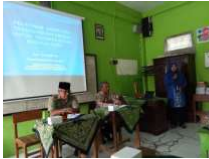
Sambutan Kepala SD Muhammadiyah Sirojuddin