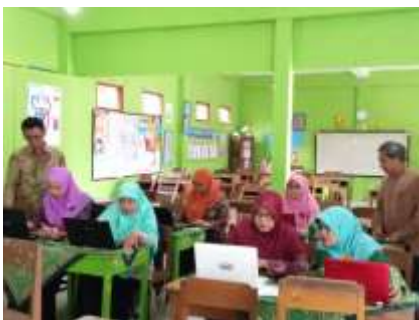
Kegiatan praktek pengenalan Excel