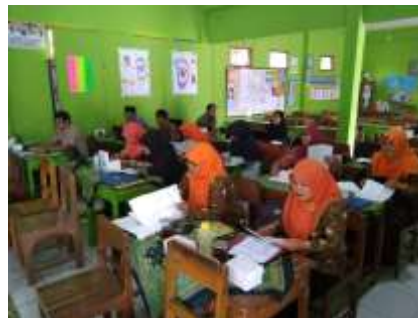
Pengenalan materi sebelum praktek