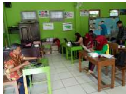
Kegiatan praktek dan evaluasi