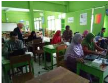
Kegiatan praktek dan bimbingan