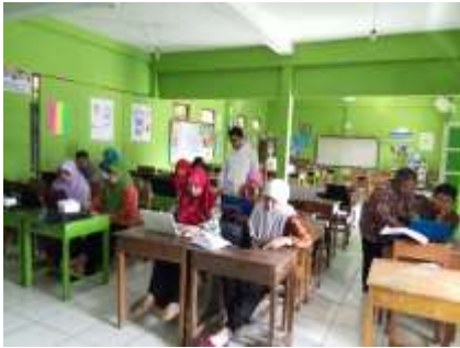
Kegiatan praktek dan bimbingan