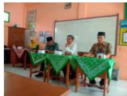
Penutupan kegiatan oleh ketua PRM Mungkid