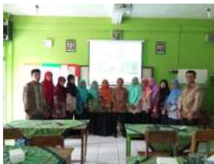
Foto bersama peserta dan pengisi materi