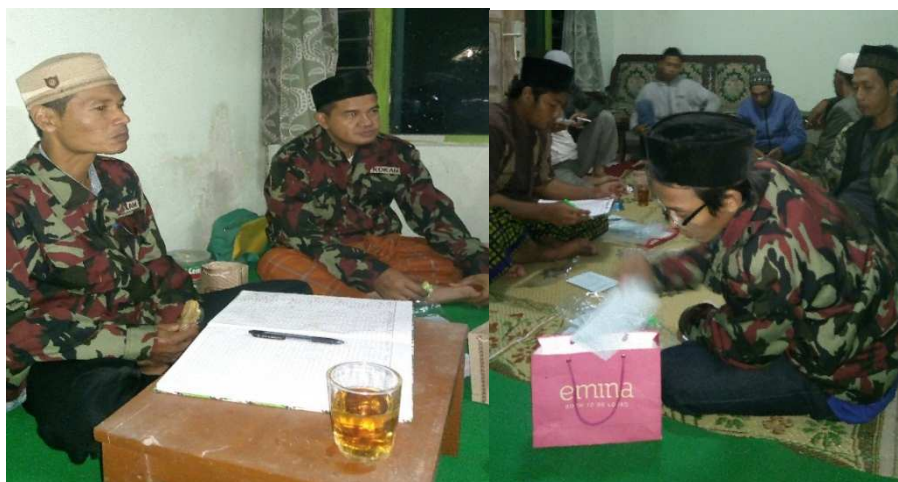
Gambar 2. Pertemuan dengan Pengurus Ranting Muhammadiyah Tosaren

Pengabdian sejenis dilakukan oleh Tri Andari, dkk dengan judul Pemberdayaan Desa Melalui Pelatihan Pengoperasian Microsoft Excel dalam Administrasi Data Matematis Desa. Hasil dari pengabdian ini adalah Para peserta yang mengikuti pelatihan dapat menguasai pengoperasian Microsoft Excel untuk pengolahan administrasi data matematis di desa. Peserta pelatihan termotivasi untuk meningkatkan mutu pelayanan administrasi desa dan proses yang terkait yang dilakukan oleh perangkat desa.[3] Arief, Ulfah Mediaty, Sukamta, Srimelakukan pengabdian dengan judul : Pelatihan Komputer Untuk Administrasi Dan Keuangan Pegawai Kelurahan Desa Tegalrejo Kecamatan Tengaran Kabupaten Semarang. Hasil dari kegiatan ini adalah penggunaan Program Microsoft Word dan Microsoft Exell dalam mengolah pekerjaan administrasi dan Keuangan yang ada pada Kelurahan Tegalrejo menghasilkan nilai post-test rata-rata 83.1% sehingga bisa meningkatkan kinerja pegawai kelurahan Desa Tegalrejo.[4]