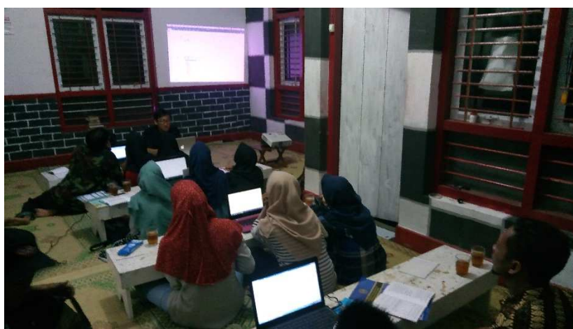
Gambar 3. Kegiatan Pelatihan

Kegiatan ini diawali dengan koordinasi dengan pengurus ranting yang dilaksanakan bersamaan dengan pertemuan rutin ranting tosaren yang dilaksanakan setiap malam Kamis Kliwon. Pertemuan ini dilaksanakan pada hari Rabu tanggal 24 Januari 2018 dari jam 19.30 – 21.30 membahas pelaksanaan kegiatan pendampingan dan pelatihan komputer. Pelatihan komputer disepakati dilaksanakan dua kali dengan materi Microsoft Word dan Microsoft Excel.