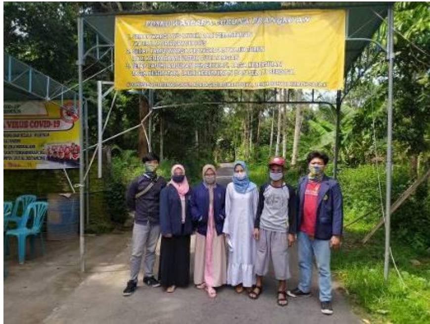
Gambar 4.1 Alat Peraga Informasi COVID 19