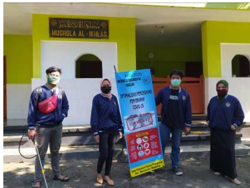
Gambar 4.4 Kegiatan Penyemprotan Disinfektan