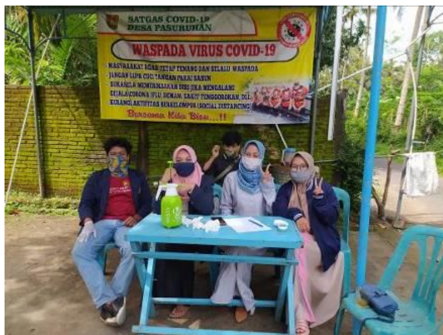
Gambar 4.2 Kegiatan Pendampingan Penjagaan Posko