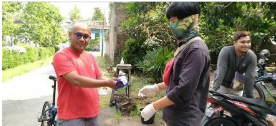
Gambar 4.5 Kegiatan Pembagian Masker