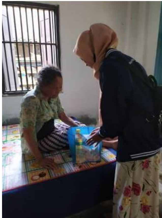
Gambar 4.3 Kegiatan Pembagian Sembako